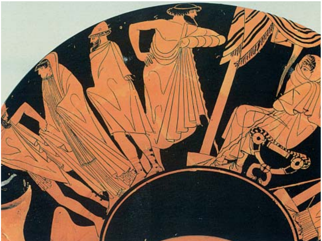
2. Η Βρισηίδα φεύγει από τη σκηνή του Αχιλλέα για να παραδοθεί στον Αγαμέμνονα. Η καθιστή μορφή δεξιά είναι ο Αχιλλέας. Από αρχαίο ελληνικό αγγείο.

Θύμωσε ο Αχιλλέας πολύ, μίσος και οργή γέμισαν την ψυχή του. Θέλησε να σκοτώσει τον Αγαμέμνονα για την προσβολή που του έκανε, μα έτρεξε η θεά Αθηνά και τον συγκράτησε. Πικραμένος όμως κλείστηκε στη σκηνή του κι ορκίστηκε να μην ξαναπολεμήσει.