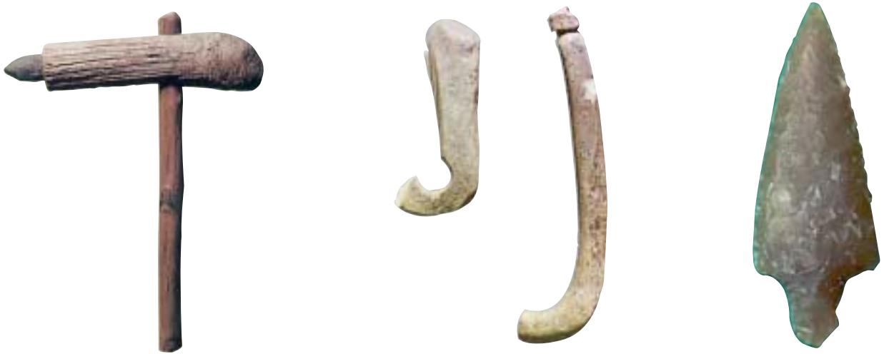
3. Πέλεκυς (τσεκούρι με ξύλινη λαβή), κοκάλινα αγκίστρια, αιχμή από πέτρινο βέλος.

Η εποχή που οι άνθρωποι ήταν τροφοσυλλέκτες και κυνηγοί λέγεται παλαιολιθική . Εργαλεία και κόκαλα ανθρώπων αυτής της εποχής έχουν βρει οι αρχαιολόγοι και στην Ελλάδα, όπως στο σπήλαιο των Πετραλώνων της Χαλκιδικής.