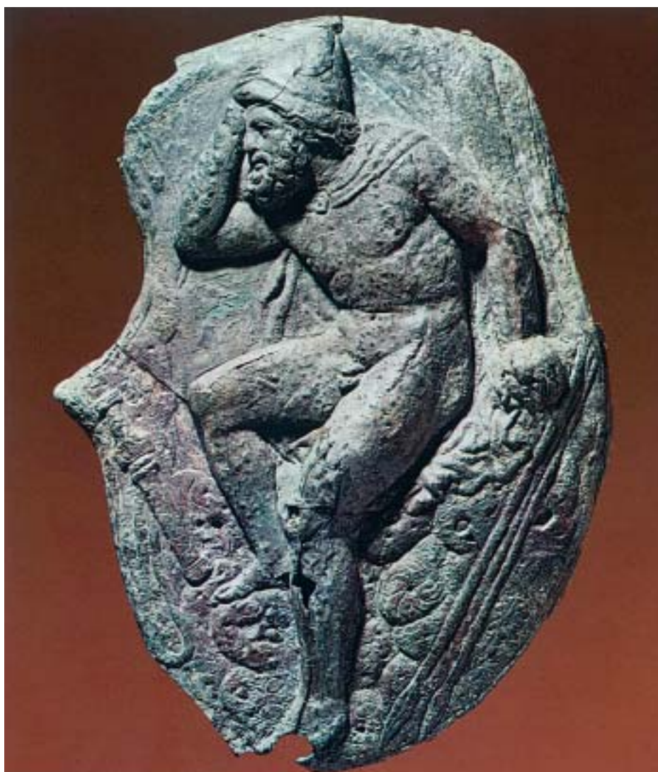
Ο Οδυσσέας αγναντεύει το πέλαγος και νοσταλγεί την πατρίδα του.

Αφού έπεσε η πόλη του Πριάμου και τέλειωσε ο δεκάχρονος Τρωικός πόλεμος, ξεκίνησαν τα πλοία των Αχαιών, για να γυρίσουν στην πατρίδα. Όμως οι θεοί του Ολύμπου ήτανε θυμωμένοι, γιατί μέσα στην Τροία οι Αχαιοί έκαψαν τους ναούς τους. Γι' αυτό τους έστειλαν ανέμους δυνατούς κι άγρια θαλασσοταραχή, για να δυσκολέψουν το ταξίδι τους. Όλοι όμως γύρισαν γρήγορα στα σπίτια τους. Μόνο ο Οδυσσέας, ο πολυμήχανος βασιλιάς απ' την Ιθάκη, περιπλανήθηκε δέκα ολόκληρα χρόνια σε θάλασσες και σε χώρες μακρινές και πέρασε πολλές ταλαιπωρίες, ώσπου να φτάσει στην Ιθάκη , την πατρίδα του. Τις περιπέτειες του Οδυσσέα μέχρι την επιστροφή του στην Ιθάκη μάς τις λέει ο Όμηρος στο έργο του « Οδύσσεια ».