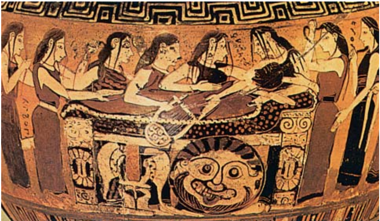
1. Οι Νηρηίδες θρηνούν τον Αχιλλέα. Από αρχαίο ελληνικό αγγείο.

Μετά από λίγες μέρες σκοτώθηκε κι ο Πάρης . Τον σκότωσε ο Φιλοκτήτης με ένα από τα δηλητηριασμένα βέλη, που του είχε χαρίσει ο Ηρακλής.