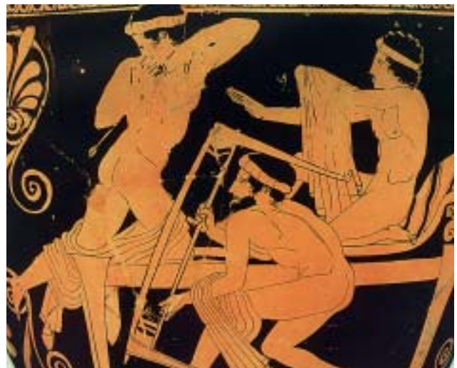
1. Ο Οδυσσέας τεντώνει το τόξο του, ενώ οι μνηστήρες προσπαθούν να σωθούν.