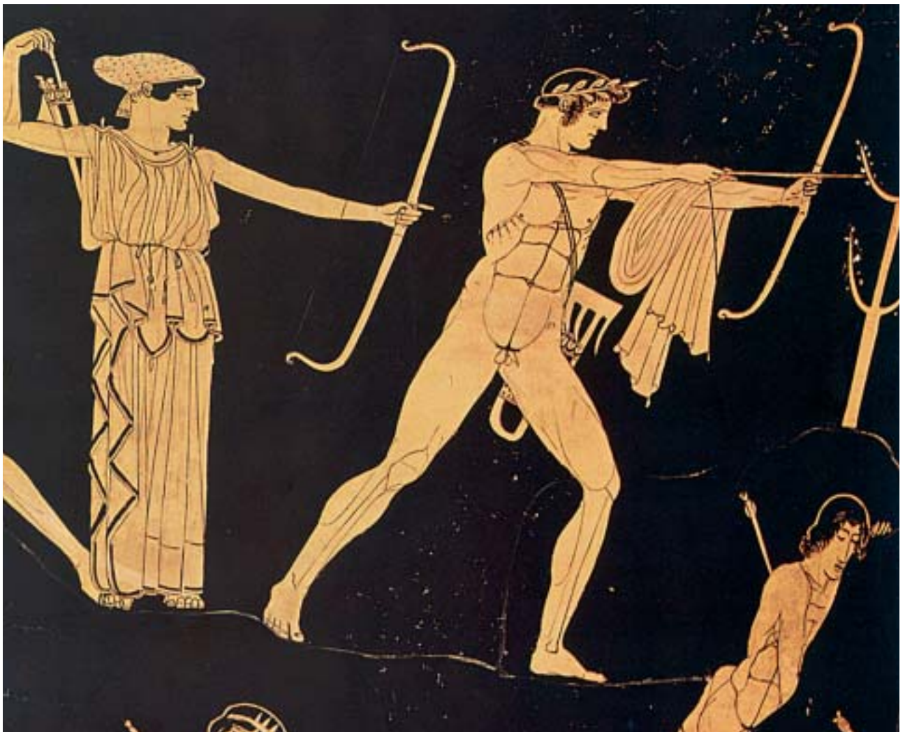
1. Ο Απόλλωνας ρίχνει τα βέλη του. Από αρχαίο ελληνικό αγγείο.

Ο Χρύσης τότε παρακάλεσε τον Απόλλωνα να τιμωρήσει σκληρά τους Αχαιούς. Ο Απόλλωνας τον άκουσε από τον Όλυμπο κι αμέσως πήρε το τόξο του και πήγε στο στρατόπεδο των Αχαιών. Κάθισε παράμερα και αόρατος χτυπούσε με τα βέλη του τα ζώα και τους ανθρώπους. Έπεσε τότε αρρώστια φοβερή ανάμεσά τους και πέθαιναν οι Αχαιοί, ο ένας μετά τον άλλο.