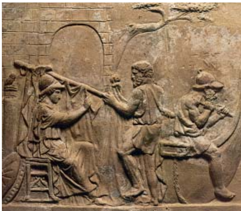
1. Η Αθηνά και ο Άργος(δεξιά) κατασκευάζουν την Αργώ. Αρχαίο ελληνικό ανάγλυφο.

Ταξιδεύοντας για την Κολχίδα, οι Αργοναύτες σταμάτησαν στη Θράκη. Εκεί συνάντησαν το μάγνη Φινέα, που τους φανέρωσε ότι θα συναντούσαν στο ταξίδι τους τις Συμπληγάδες πέτρες και τους συμβούλεψε, πριν περάσουν ανάμεσά τους, ν' αφήσουν πρώτα ένα περιστέρι να περάσει. Αν περνούσε το περιστέρι, θα περνούσε και η Αργώ.