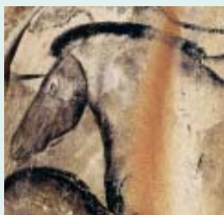
Βίσονας, μαμούθ και άλογα από βραχογραφίες σπηλαίων της Ευρώπης.