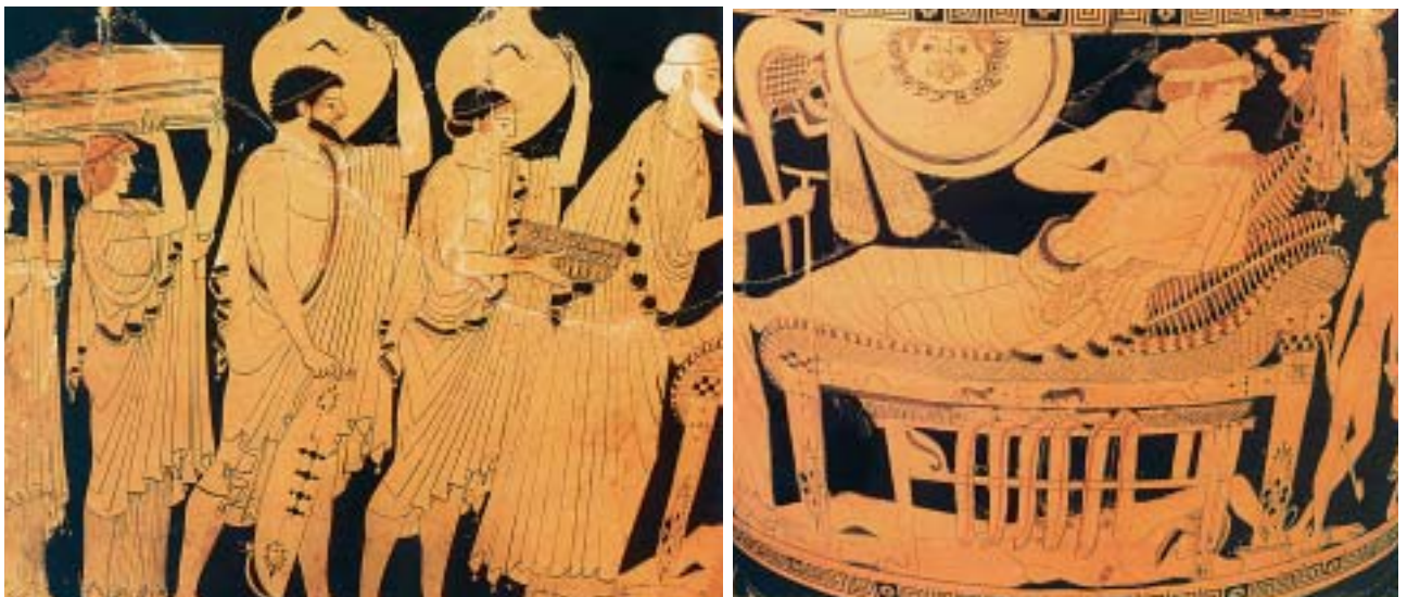
3. Ο Πρίαμος έρχεται με δώρα στη σκηνή του Αχιλλέα και τον ικετεύει. Από αρχαίο ελληνικό αγγείο.

Ο νεκρός Έκτορας έντεκα μέρες έμεινε άταφος, ώσπου ο Πρίαμος πήγε στον Αχιλλέα, έπεσε στα πόδια του και τον παρακάλεσε να του δώσει το σώμα του παιδιού του να το θάψει. Ο Αχιλλέας συγκινήθηκε. Διέταξε να πλύνουν και να στολίσουν το νεκρό και τον έδωσε στο γέρο βασιλιά, για να τον πάει στην Τροία. Και πρόσταξε να σταματήσει ο πόλεμος έντεκα μέρες, για να προλάβουνε οι Τρώες να θρηνήσουν και να κάψουν το νεκρό, όπως είχαν συνήθεια.