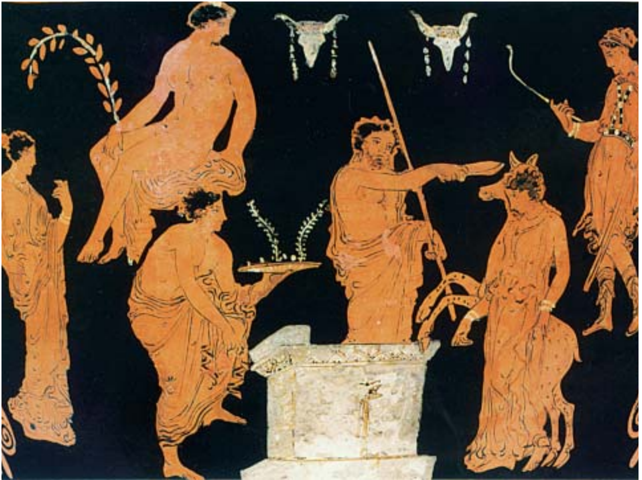
4. Η θυσία της Ιφιγένειας. Από αρχαίο ελληνικό αγγείο.