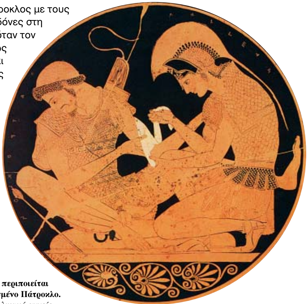
1. Ο Αχιλλέας περιποιείται τον τραυματισμένο Πάτροκλο. Από αρχαίο ελληνικό αγγείο.

Όρμησε ο Πάτροκλος με τους γενναίους Μυρμιδόνες στη μάχη. Οι Τρώες, όταν τον είδαν, νόμισαν πως ήταν ο Αχιλλέας κι έφυγαν τρέχοντας προς την Τροία.