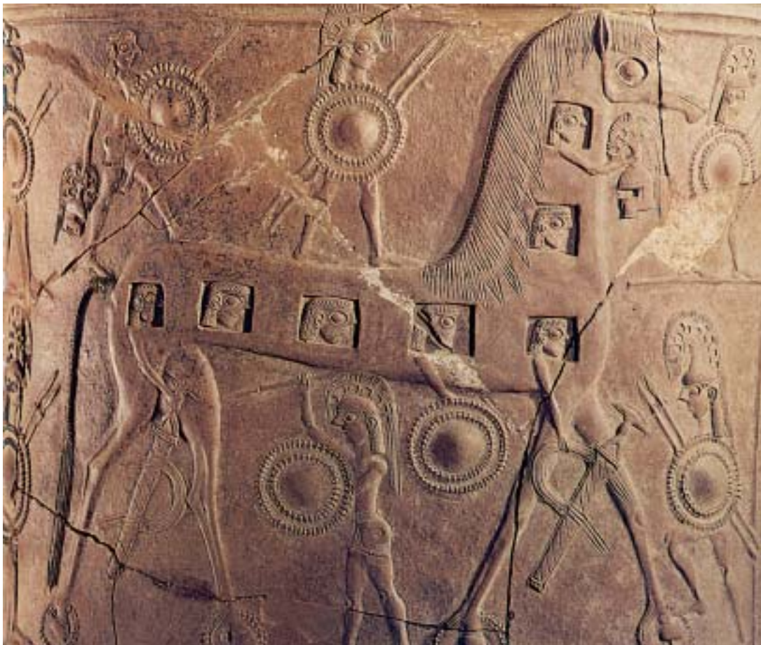
1. Ο Δούρειος ίππος. Από αρχαίο ελληνικό αγγείο.

Άδικα η Κασσάνδρα , φώναζε πως μέσα στην κοιλιά του ήταν κρυμμένοι Αχαιοί. Κανένας δεν την πίστευε. Κι ένας Τρώας, ο Λαοκόοντας, που ήταν ιερέας του Απόλλωνα, είπε: «Να φοβάστε τους Αχαιούς ακόμη κι αν σας φέρνουν δώρα».