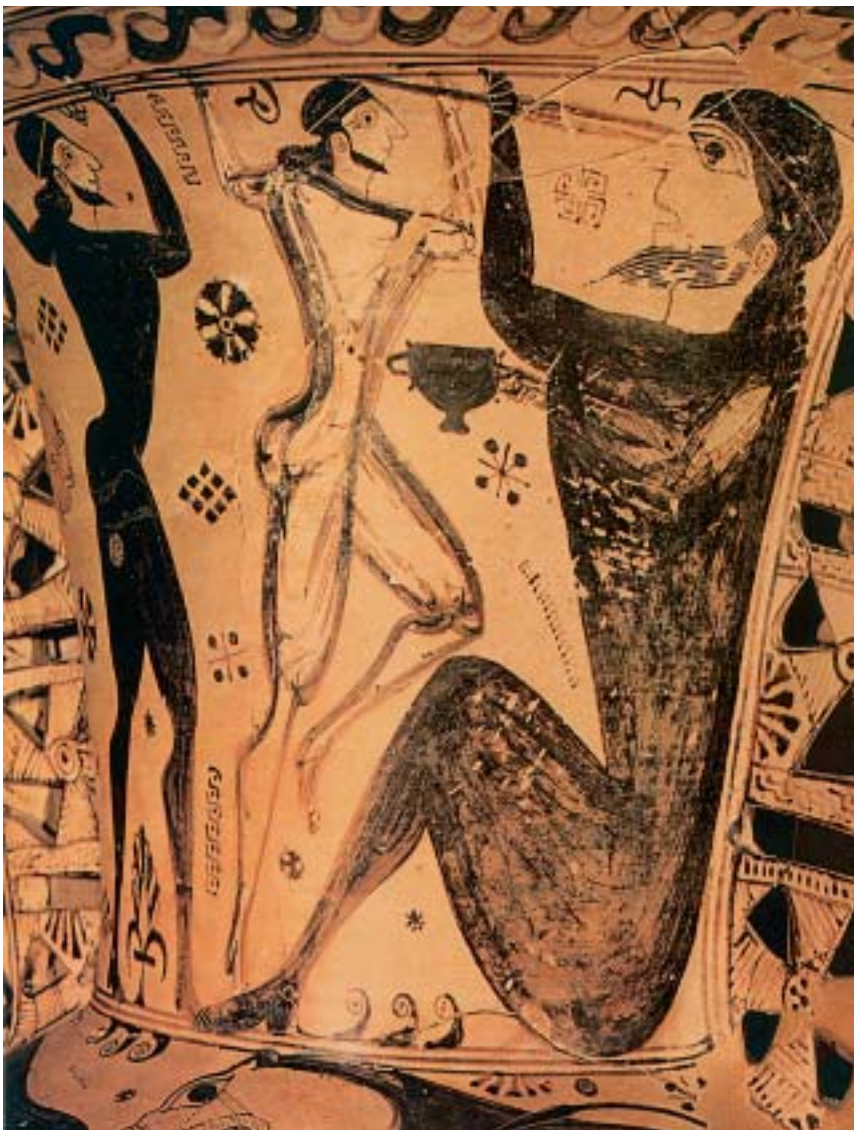
1. Ο Οδυσσέας και οι σύντροφοί του τυφλώνουν τον Πολύφημο.

Άρπαξε τότε ένα τεράστιο βράχο ο Κύκλωπας και τον έριξε στο καράβι, μα δεν το χτύπησε. Κι αμέσως σήκωσε τα χέρια του στον ουρανό και είπε: «Πατέρα, Ποσειδώνα, τον Οδυσσέα που με τύφλωσε μην τον αφήσεις να γυρίσει στην Ιθάκη, μα αν είναι να γυρίσει, να περάσει χίλια βάσανα , να φτάσει μόνος, με ξένο πλοίο, κι εκεί να τον βρουν καινούριες συμφορές».