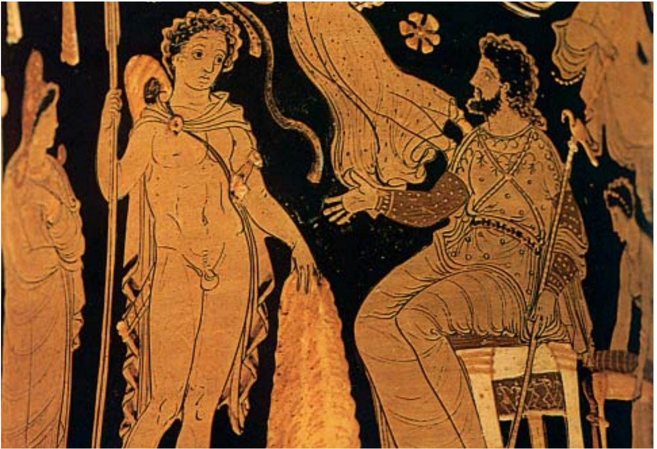
2. Ο Ιάσοντας παραδίδει το χρυσόμαλλο δέρας στον Πελία. Από αρχαίο ελληνικό αγγείο.