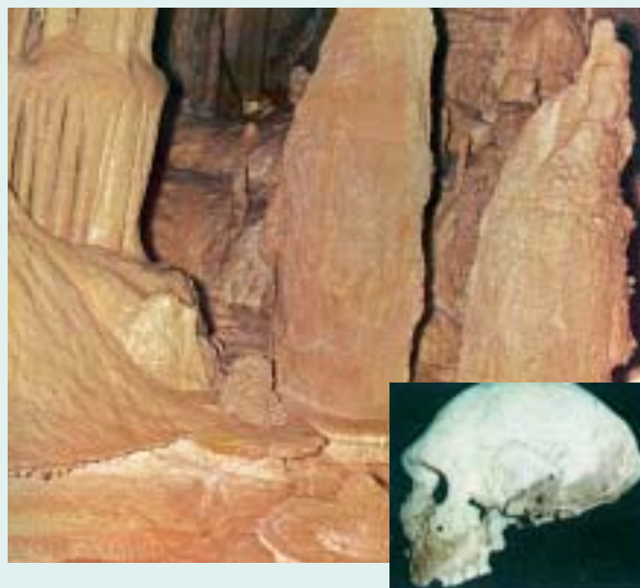
7. Το σπήλαιο των Πετραλώνων και το ανθρώπινο κρανίο που βρέθηκε εκεί.

Wells G., Ο Προϊστορικός άνθρωπος και η ζωή του , μτφ. Ε. Πανέτσου, σελ. 18-19 (με αλλαγές)