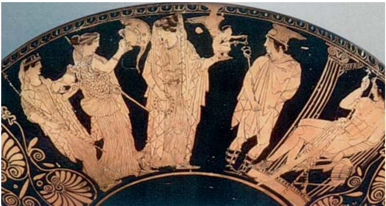
1. Η κρίση του Πάρη. Δεξιά ο Πάρης, στο κέντρο ο θεός Ερμής και ακολουθούν οι τρεις θεές: Αφροδίτη, Αθηνά, Ήρα. Από αρχαίο ελληνικό αγγείο.

Η Ήρα και η Αθηνά έφυγαν θυμωμένες, ενώ η Αφροδίτη φανέρωσε στον Πάρη πως η ωραία Ελένη , η γυναίκα του Μενέλαου, του βασιλιά της Σπάρτης, ήταν η ομορφότερη στον κόσμο και τον συμβούλεψε να πάει να την πάρει.