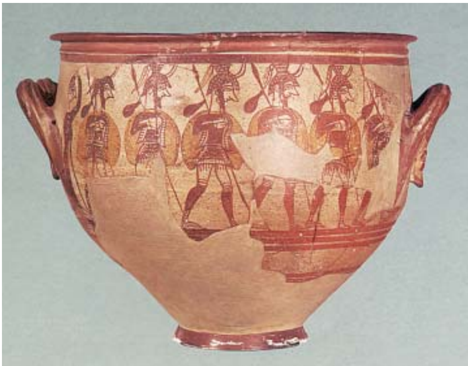
1. Αχαιοί πολεμιστές. Αρχαίο ελληνικό αγγείο.

Διάλεξαν για αρχηγό τον Αγαμέμνονα κι αφού έκαναν θυσίες, περίμεναν να φυσήξει ο άνεμος , να ξεκινήσουν τα καράβια για την Τροία.