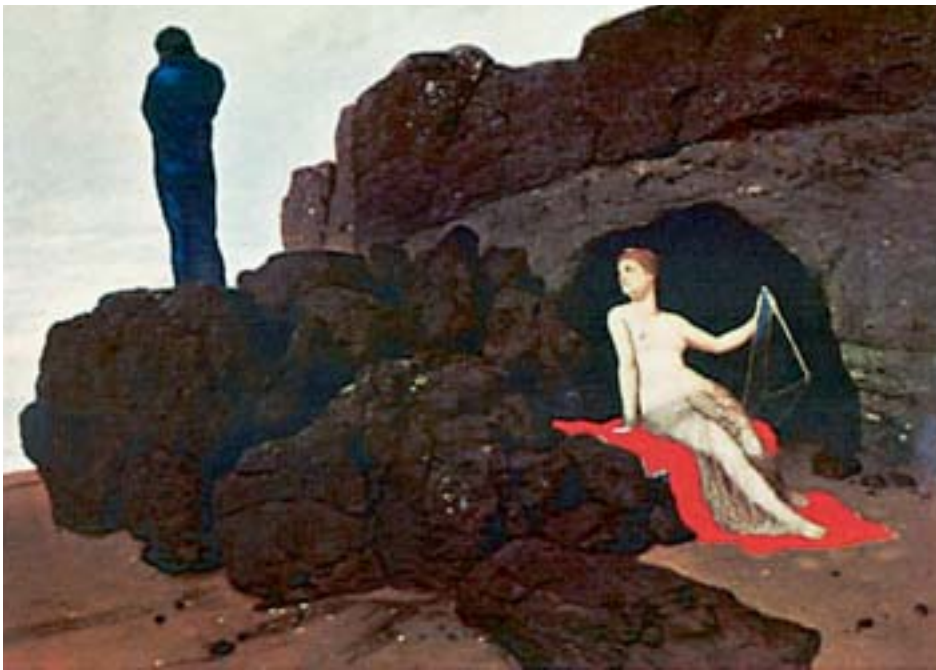
2. Οδυσσέας και Καλυψώ. Έργο ζωγραφικής της νεότερης εποχής.