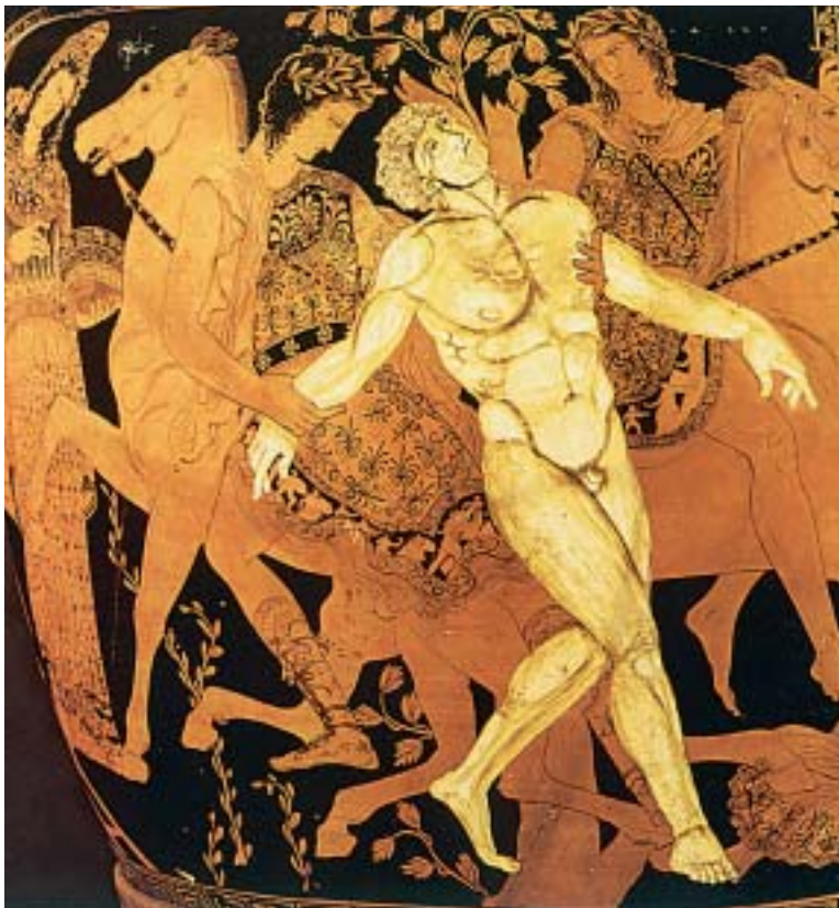
5. Ο Τάλως ετοιμοθάνατος. Αριστερά η Μήδεια. Από αρχαίο ελληνικό αγγείο.

Απολλόδωρος, Βιβλιοθήκη Α 9, 26 (διασκευή)