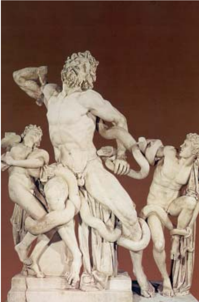
2. Ο Λαοκόοντας και οι δυο γιοί του. Αρχαίο ελληνικό γλυπτό.

Αμέσως δυο τεράστια φίδια σταλμένα από τον Ποσειδώνα, βγήκαν από τη θάλασσα κι έπνιξαν τον Λαοκόοντα μαζί με τα παιδιά του.