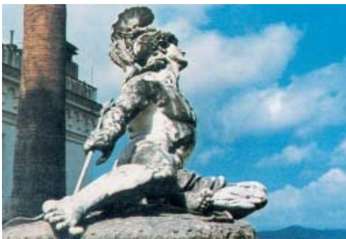
4. Ο θάνατος του Αχιλλέα. Γλυπτό της νεότερης εποχής.