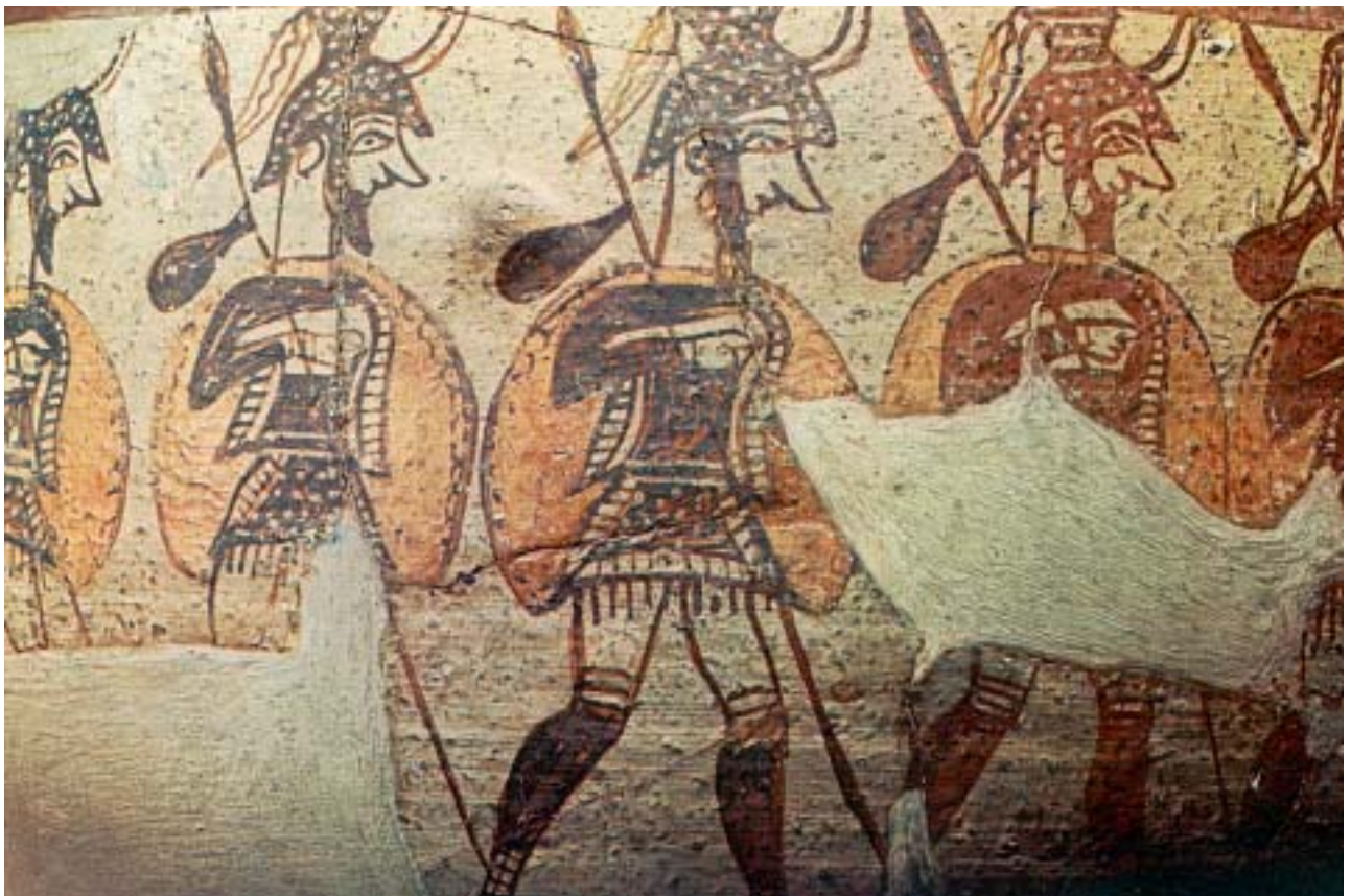
Αχαιοί πολεμιστές ξεκινούν για τον πόλεμο. Λεπτομέρεια από αρχαίο ελληνικό αγγείο.

Τι να πρωτοθυμηθεί κανείς απ' όλα αυτά που έγιναν. Οι μύθοι που τα αναφέρουν είναι τόσο γοητευτικοί, που αξίζει τον κόπο να τους διαβάσουμε και να τους θυμόμαστε για πάντα.