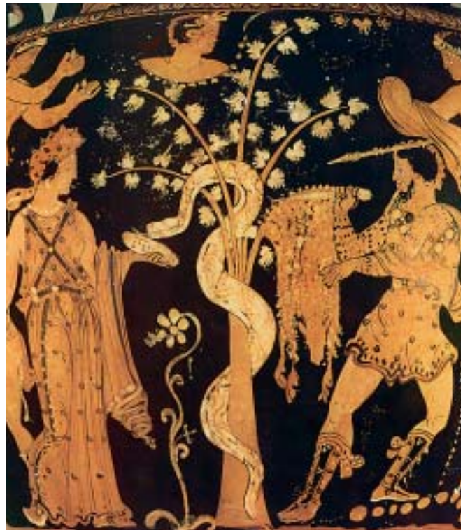
1. Ενώ η Μήδεια αποκοιμίζει το δράκο, ο Ιάσοντας αρπάζει το χρυσόμαλλο δέρας.

Ο Ιάσοντας πήγαινε συχνά και καθόταν κοντά στην Αργώ. Κάποτε όμως, κι ενώ είχε γίνει πια γέρος, έπεσε ένα ξύλο από το κατάρτι της Αργώς και τον σκότωσε.