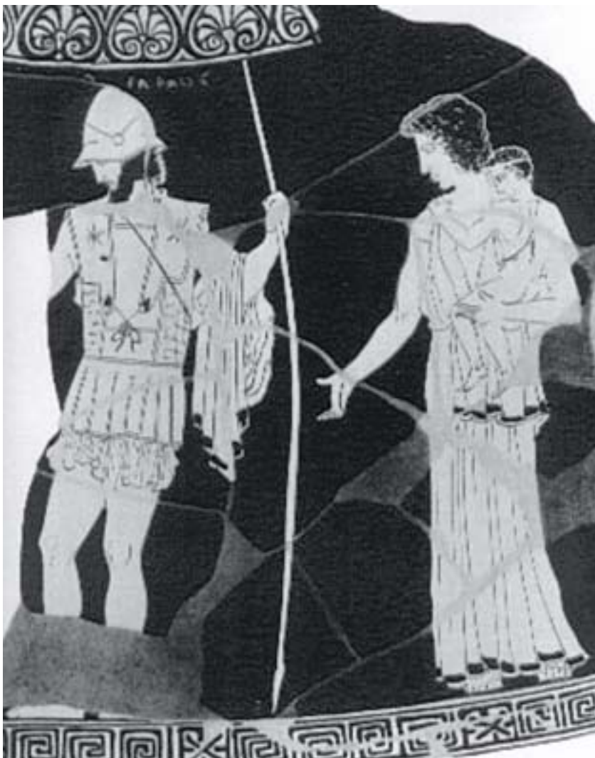
1. Ο Έκτορας αποχαιρετά την Ανδρομάχη και τον Αστυάνακτα.

Μόνο ο γενναίος Έκτορας δεν κλείστηκε στα τείχη, αλλά έμεινε να αντιμετωπίσει τον εχθρό. Άδικα του φώναζαν ο Πρίαμος και η Εκάβη , η μητέρα του, και η όμορφη