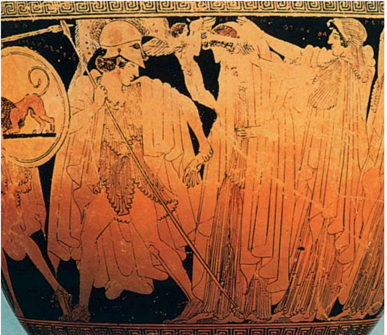
2. Η αρπαγή της Ελένης από τον Πάρη. Ανάμεσά τους ο φτερωτός θεός Έρωτας. Από αρχαίο ελληνικό αγγείο.

Ο Πάρης ετοίμασε καράβι γρήγορο κι έφυγε για τη Σπάρτη . Έφτασε στο παλάτι του Μενέλαου κρατώντας πλούσια δώρα. Εκεί όλοι τον καλοδέχτηκαν και τον φιλοξένησαν, όπως ταίριαζε στο βασιλόπουλο της Τροίας. Όμως ο Πάρης, με τη βοήθεια της Αφροδίτης, ξεμυάλισε την Ελένη και την έπεισε να τον ακολουθήσει. Και μια μέρα που έλειπε ο Μενέλαος, έφυγαν για την Τροία .