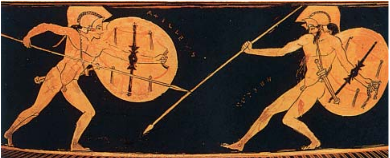
2. Μονομαχία Αχιλλέα-Έκτορα. Από αρχαίο ελληνικό αγγείο.

Αμέσως ο Αχιλλέας πήρε τα όπλα τού νεκρού, έδεσε τα πόδια του με δερμάτινα λουριά από το άρμα κι άφησε το κεφάλι του να σέρνεται στο χώμα. Μετά χτύπησε τ' άλογά του κι εκείνα έτρεξαν γρήγορα προς τα πλοία σέρνοντας το νεκρό Έκτορα μαζί τους.