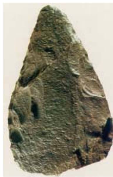
1. Χειροπέλεκυς, το πρώτο εργαλείο του ανθρώπου.