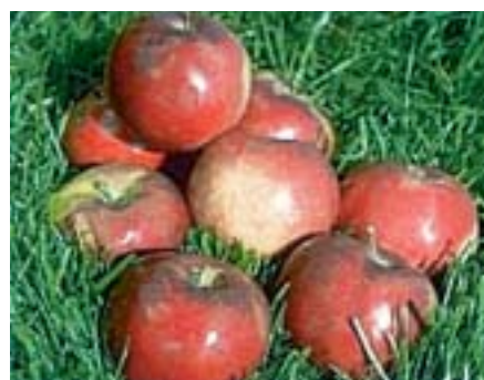
2. Τροφές των πρώτων ανθρώπων.