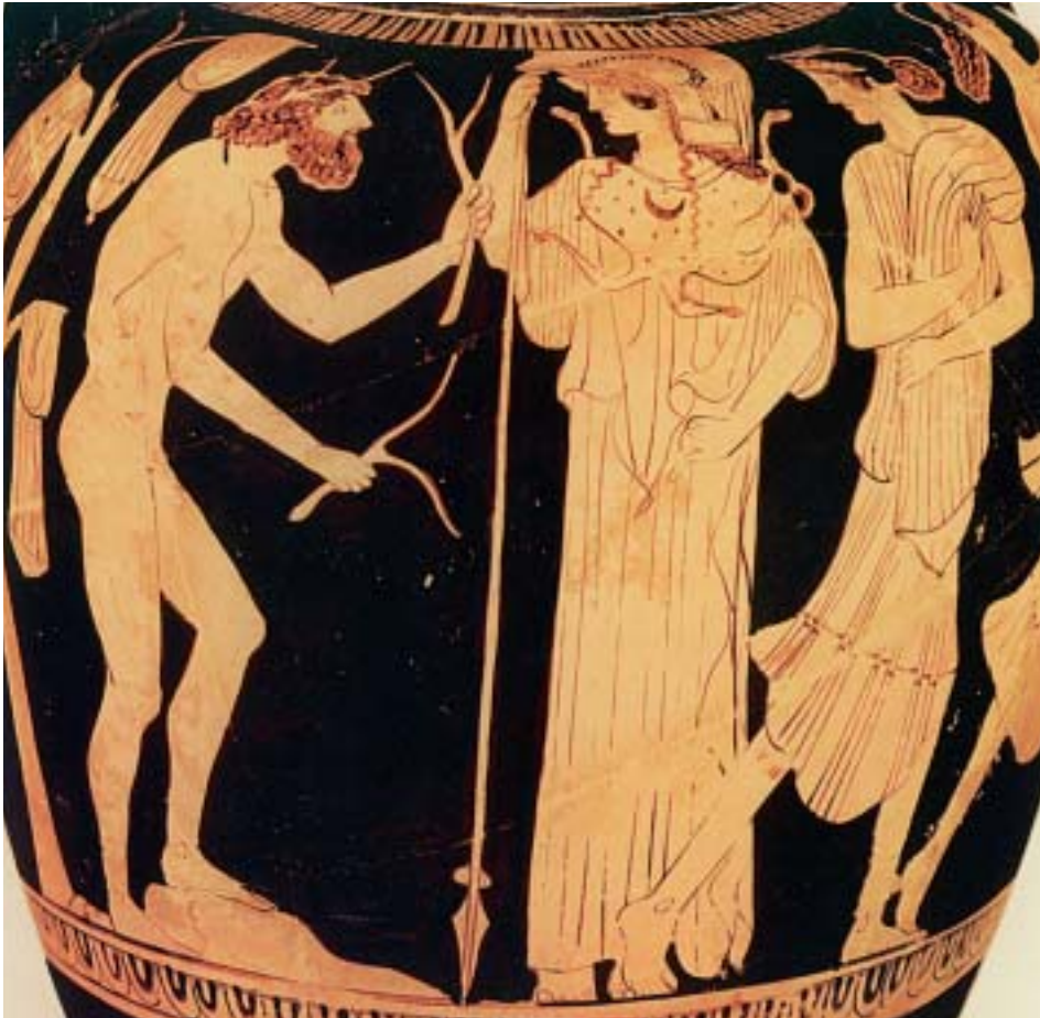
4. Ο Οδυσσέας, η θεά Αθηνά και η Ναυσικά. Από αρχαίο ελληνικό αγγείο.