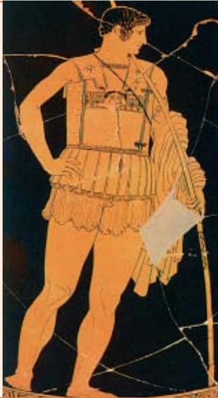
Ο Αχιλλέας. Από αρχαίο ελληνικό αγγείο.