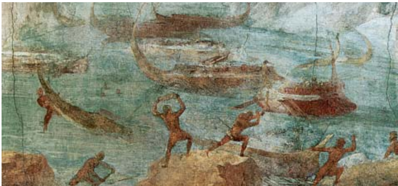
1. Οι Λαιστρυγόνες ρίχνονται στα πλοία των Αχαιών με βράχους και πέτρες (τοιχογραφία).

Οι άνεμοι τούς έριξαν μετά στο νησί της μάγισσας Κίρκης. Άραξαν σε μια ακρογιαλιά κι ο Οδυσσέας έστειλε μερικούς απ' τους συντρόφους του να πάνε να ρωτήσουν πού βρισκόνταν. Αυτοί βρήκαν γρήγορα το παλάτι της Κίρκης. Η Κίρκη τούς πρόσφερε ένα μαγικό ποτό, μετά τους χτύπησε με το μαγικό ραβδί της και τους έκανε γουρούνια . Μόνο ένας γλίτωσε κι έτρεξε πίσω να το πει στον Οδυσσέα. Εκείνος άρπαξε το σπαθί του κι έτρεξε στο παλάτι. Η Κίρκη τού πρόσφερε ποτό μα, όταν σήκωσε το ραβδί της να τον χτυπήσει, εκείνος άρπαξε το κοφτερό σπαθί του και την ανάγκασε να ξανακάνει τους συντρόφους του ανθρώπους. Έμειναν αρκετό καιρό στης Κίρκης το νησί. Όταν αποφάσισαν να φύγουν, η Κίρκη συμβούλεψε τον Οδυσσέα να κατεβεί στον Άδη, να βρει το μάντη Τειρεσία , να τον ρωτήσει πώς θα έφτανε στην Ιθάκη.