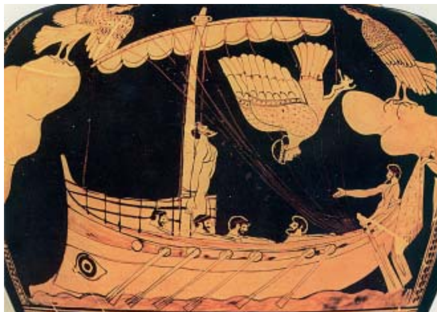
3. Ο Οδυσσέας στις Σειρήνες. Από αρχαίο ελληνικό αγγείο.